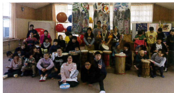
「あふりかじゃんぐる」さんと一緒に

「はーとあーと倶楽部」がこれからもずっと自己表現の場所、ほっとできる場所、子どもも親も支援者もみんな一緒に笑顔になれる場所であり続けること、そして仲間が増えることが私たちの願いです。